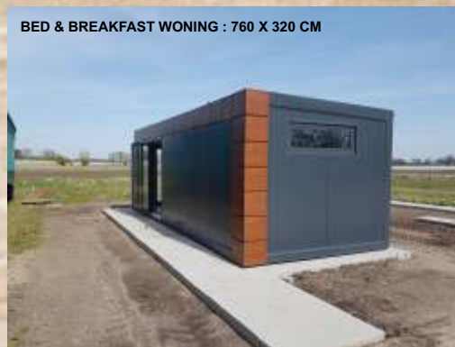
BED & BREAKFAST WONING : 760 X 320 CM