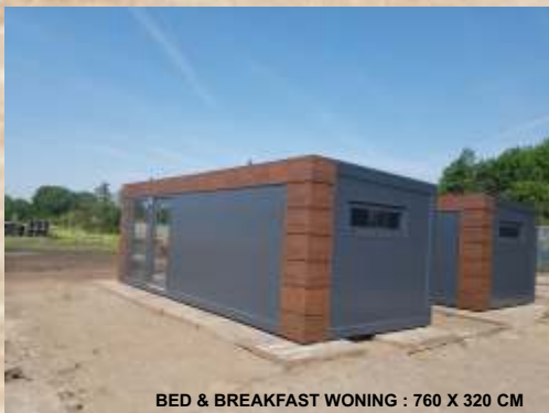
BED & BREAKFAST WONING : 760 X 320 CM